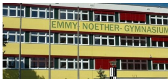
Fehlende Schulplätze und keine Lösungen in Sicht