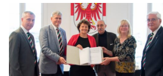
270 Bürgermeister & Ortsvorsteher fordern Umsteuern bei Windkraftausbau