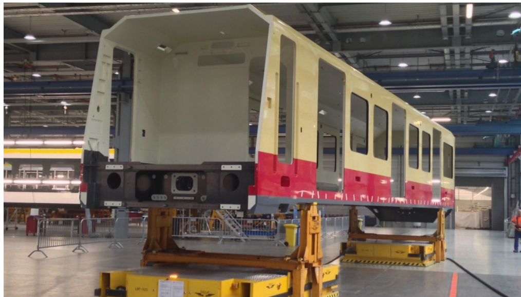
Erster Wagenkasten der neuen S-Bahn für Berlin und Brandenburg eingetroffen - Foto: DB AB/Katrin Block

m/s 14. Oktober 2017 Berliner Verkehr, Bezirksnachrichten, Slider