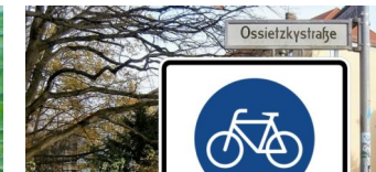
Ossietzkystraße wird zur Fahrradstraße