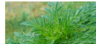
Ambrosia artemisiifolia rechtzeitig bekämpfen!