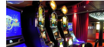
Stadtweite Kontrollen von Spielstätten