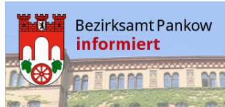
Bezirk Pankow übt Vorkaufsrecht aus