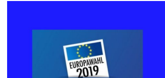
Neue Geometrien der Wahlbezirke zur Europawahl 2019