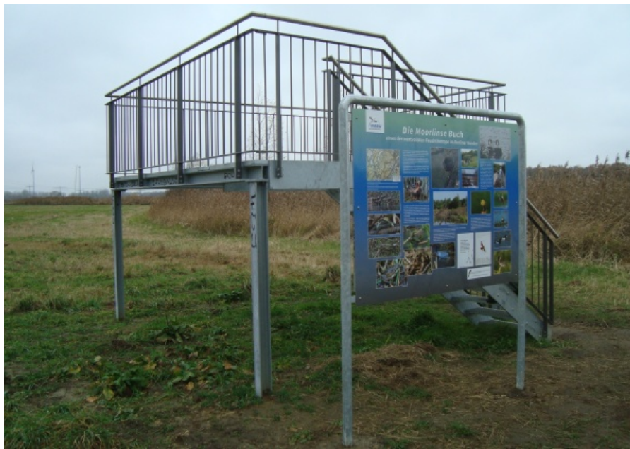
Beobachtungsplattform an der Moorlinze mit Info-Tafel des NABU