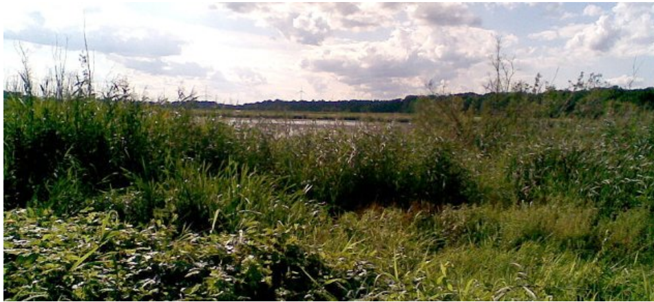
Moorlinse in Buch – Gewässer in Nähe der Moorwiese