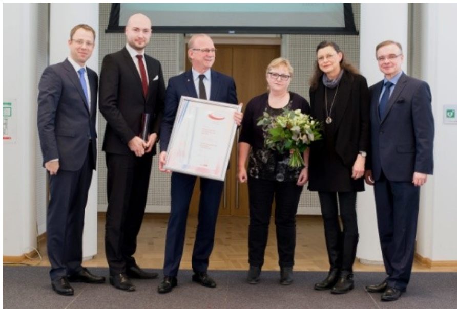
Verleihung des Inklusionspreis 2015 an Kindergärten Nordost

In diesem Jahr wurde der Preis für Großunternehmen von Mario Czaja, Senator für Gesundheit und Soziales, und Franz Allert, Präsident des Landesamtes für Gesundheit und Soziales, an die Kindergärten NordOst vergeben: