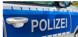
Polizeibericht vom 31.05.2019