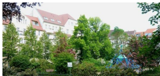
Neugestaltung des Spielplatzes Solonplatz