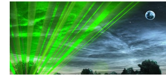
Lasershow im Strandbad Weissensee