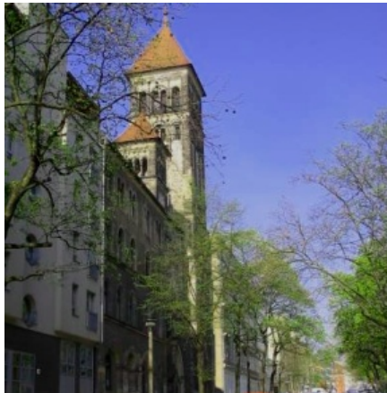
Kirche Herz-Jesu in Prenzlauer Berg

Der Verband für Interkulturelle Arbeit Berlin/Brandenburg (VIA), das Projekt „Frostschutzengel“ der GEBEWO – Soziale Dienste – Berlin gGmbH und des Caritasverbands für das Erzbistum Berlin e. V. sowie das Team „Streetwork an Brennpunkten“ des Gangway e.V. haben den Berliner Kältehilfewegweiser 2014/2015 auch in die Sprachen Polnisch, Bulgarisch, Russisch und Spanisch übersetzt.