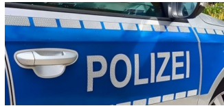
Polizeibericht vom 19.09.2019