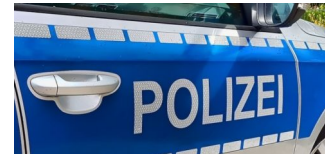
Polizeibericht vom 01.09.2019