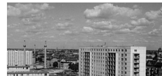
Ausstellung „Städtebauliche Planung Michelangelostraße“