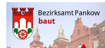
Umbau am Straßenknoten Duncker-/Krüger-/Kuglerstraße