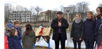
Neue Schilder gegen das Entenfüttern präsentiert