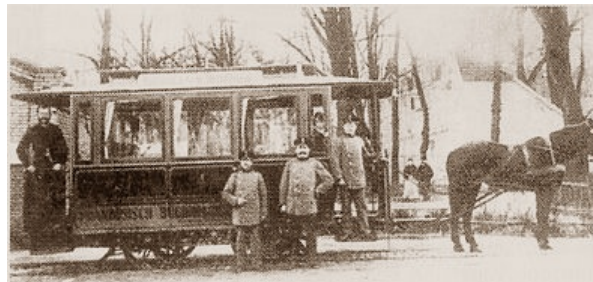
Pferdebahn in Französisch-Buchholz 1904