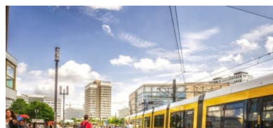
Mobilitätsgesetz: Verbesserungen für den Fußverkehr