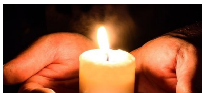
Lichterkette zum Holocaust-Gedenntag am 27. Januar 2020