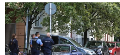
Berliner Verkehrssicherheitstage 17.-21.2.2020