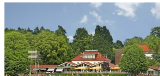
Saisonbeginn im Strandbad Wandlitzsee wird verschoben