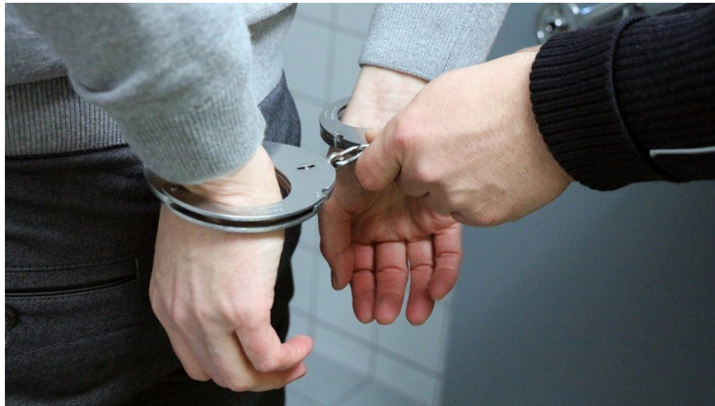
Heroindealer festgenommen

m/s 10. Oktober 2018 Bezirksnachrichten, Polizeimeldungen, Slider