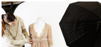
Modekonzern H&M setzt auf Secondhand-Mode