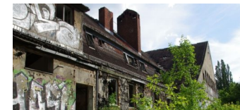
Sicherungsmaßnahmen: ehemaliges Kinderkrankenhaus Weißensee