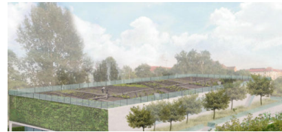
Kleingärtner fordern „grüne Turnhalle“ als Ausgleich