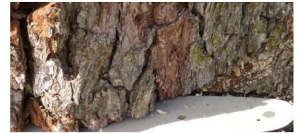
Fällung einer Pappel an der Friedrich- Engels-Straße