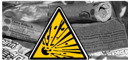
Silvester 2019: Pyrotechnik Verbotbereiche