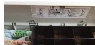
Kostenfreiheit im Schulhort: Eltern zahlen munter weiter!