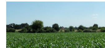
Vorkaufsrecht für 70.000 m² Wohnbauflächen in Karow