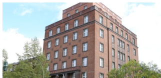
Sprechstundenausfall in einem Fachbereich des Jugendamtes