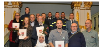
Pankower Ehrenamtspreis 2019 verliehen