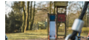
Spielplatz Walter-Friedrich-Straße in Buch wird neu gebaut