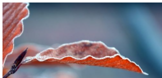
Der erste Nachtfrost wird erwartet