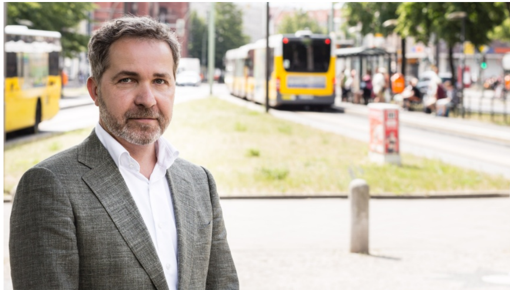
Pankows Bezirksbürgermeister Sören Benn - Foto: Pressefoto

m/s 17. Oktober 2019 Aktuell, Bezirksnachrichten, Slider