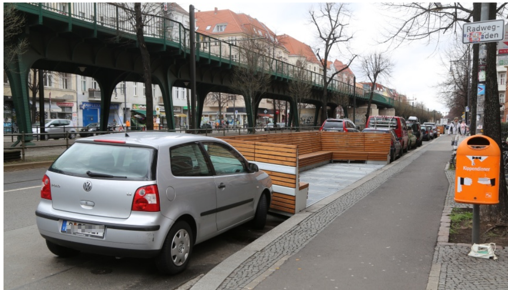
Parklet in der Schönhauser Allee: Freiraum, Plattform und mehr ....

m/s 12. August 2019 Aktuell, Bezirksnachrichten, Slider