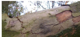
Rückschnitt wegen Pilzbefall bei Platanen in der Kollwitzstraße