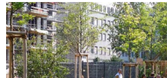
„Bürgerstadt Buch“ stellt die Wohnungsbau-Frage neu