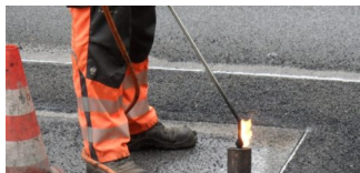
Fahrbahnsanierungen in der Gustav-Adolf-Straße