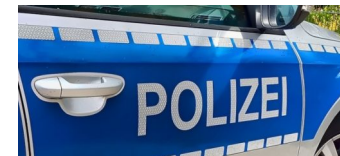
Polizeibericht vom 04.05.2019