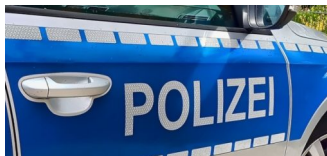
Polizeibericht vom 17.04.2019