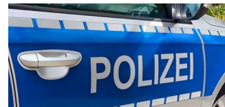
Polizeibericht vom 20.04.2019