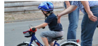
Jugendverkehrsschule lädt zum Tag der offenen Tür 2019