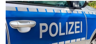
Polizeibericht vom 01.05.2019