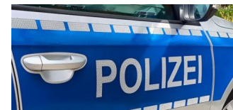
Polizeibericht vom 06.11.2019