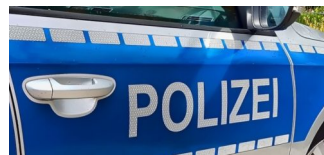
Polizeibericht vom 03.12.2019