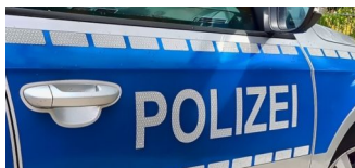
Polizeibericht vom 16.09.2019