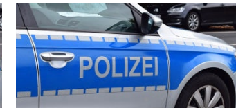
Polizeibericht vom 04.03.2019