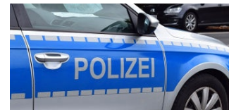
Polizeibericht vom 10.02.2019