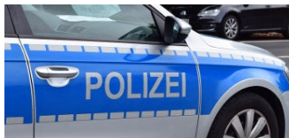
Polizeibericht vom 21.03.2019