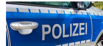
Polizeibericht vom 21.11.2019