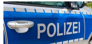
Polizeibericht vom 28.11.2019