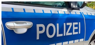
Polizeibericht vom 24.10.2019