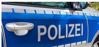
Polizeibericht vom 17.09.2019