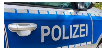
Polizeibericht vom 22.09.2019