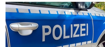
Polizeibericht vom 21.11.2019