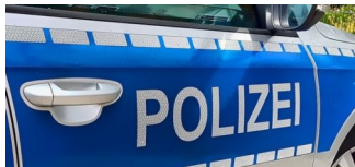
Polizeibericht vom 27.09.2019