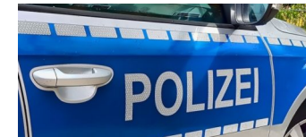
Polizeibericht vom 07.10.2019