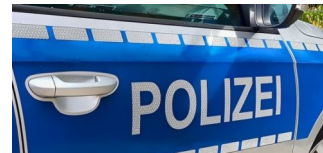
Polizeibericht vom 24.09.2019