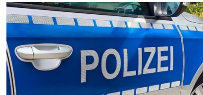
Polizeibericht vom 09.01.2020