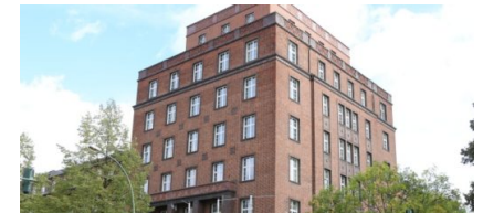
Neuer Auskunftsdienst im Jugendamt ab 1. Januar 2020