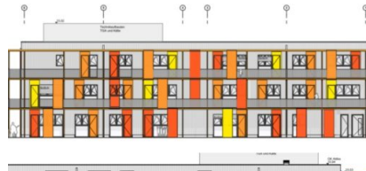
Neue Kindertagesstätte in Pankow