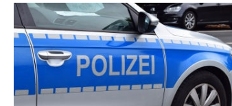
Polizeibericht vom 04.03.2019