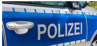
Polizeibericht vom 19.04.2019