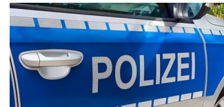
Polizeibericht vom 17.04.2019