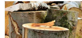
Baumfällungen auf dem Fröbelplatz notwendig