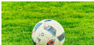
Sportjournalismus & Sponsoring: „Wie kommt der Euro in den Ball?“