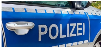
Antisemitische Attacke in Karow wird scharf verteilt