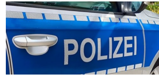
Polizeibericht vom 07.12.2019