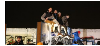
Treffen am „Platz des 9. November“ an der Bösebrücke