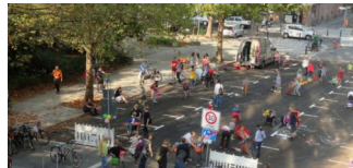
Demonstration für die „Temporäre Spielstraße“ am 8.5.2019