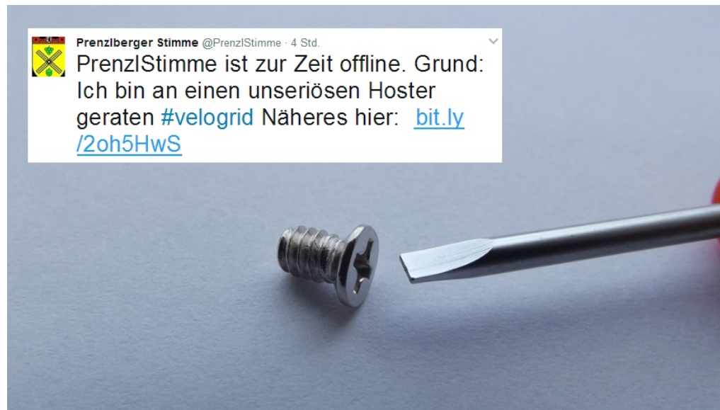
Prenzlberger Stimme offline - woran liegt es? - Foto: pixabay, Montage