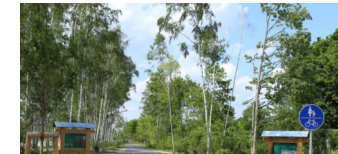
Die schönsten Rad-Touren durch Pankow