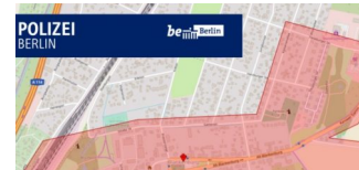
1. Mai 2019: Polizei informiert über Versammlungen in Blankenburg