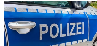
Polizeibericht vom 16.09.2019