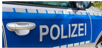
Polizeibericht vom 02.12.2019