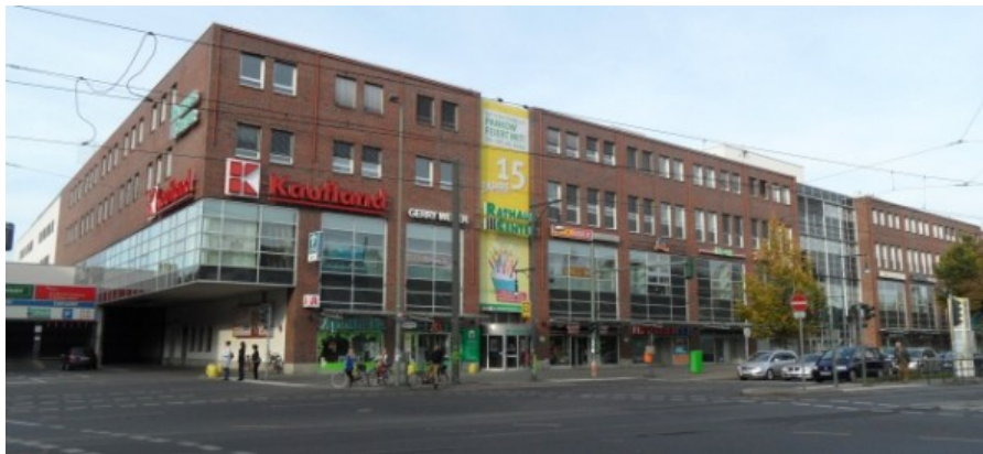
Rathaus-Center Pankow: Antrag auf Bauvorbescheid gestellt