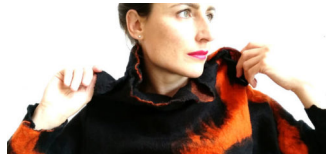
Bedarfsanalyse zur Zukunft der Mode