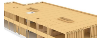
Neue Kita wird in Holzbauweise gebaut