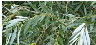
Rundgang: Bäume in der Seelower Straße