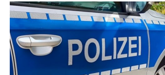
Polizeibericht vom 15.11.2019