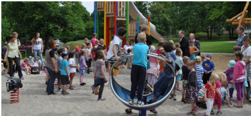
Spielplatzzeröffnung in Buch am 13.6.2013