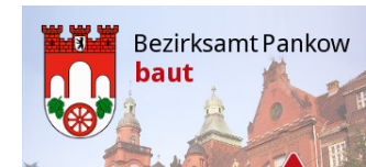
Umbau am Straßenknoten Duncker-/Krüger-/Kuglerstraße