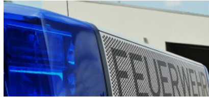
Brand in Pflegeeinrichtung in der Rennbahnstraße in Weißensee