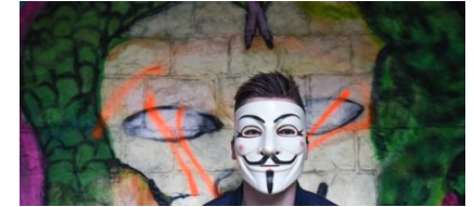
Werden „Digital Natives“ überschätzt?