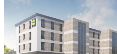
Lidl präsentiert erste Filiale mit Wohnungen in Modulbauweise