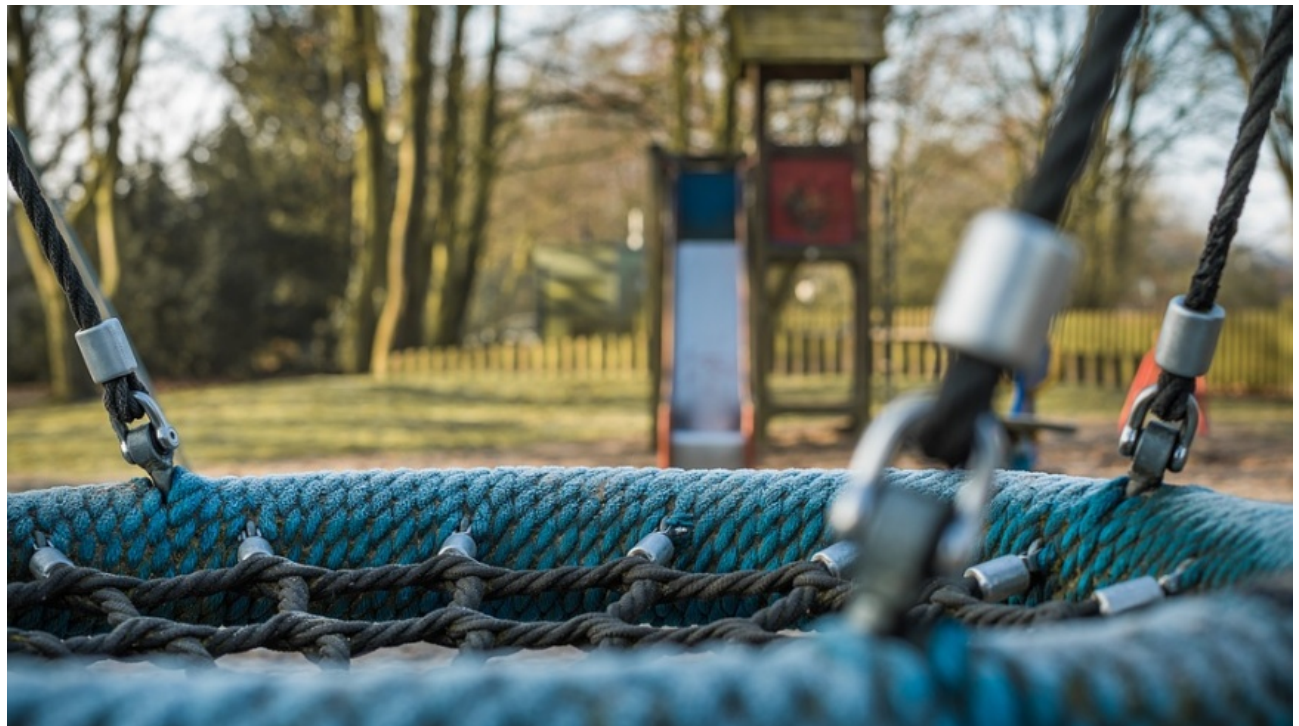
Öffentliche Kinderspielplätze gehören zu Grundausrüstung einer Stadt