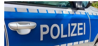
Polizeibericht vom 20.12.2019