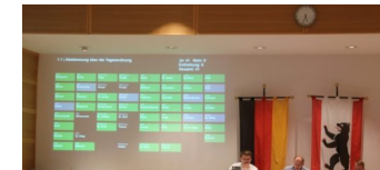
BVV-Sondersitzung zum 'Klimaschutz im Bezirk Pankow'