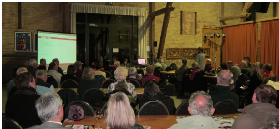
Bucher Bürgerforum am 16.1.2014