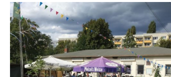
Erntedankfest am 7. & 8. September in den Bornholmer Gärten