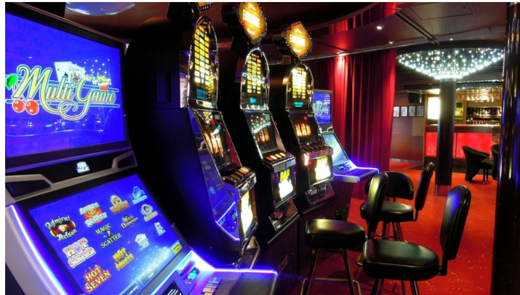
Im Visier von Polizei, Steuerfahndung und LKA: Spielautomaten in Spielhalle

m/s 29. März 2019 Bezirksnachrichten, Polizeimeldungen