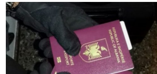
Schleuserkriminalität: Durchsuchungsbeschlüsse und Haftbefehle vollstreckt