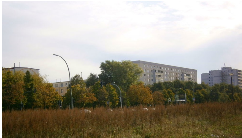
Michelangelostraße in Prenzlauer Berg