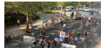
Temporäre Straßen-Spieltage in der Gudvanger Straße