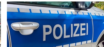
Polizeibericht vom 31.05.2019