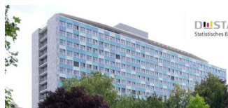
CO2-Emissionen und klimawirksame Treibhausgase