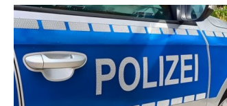
Polizeibericht vom 09.10.2019