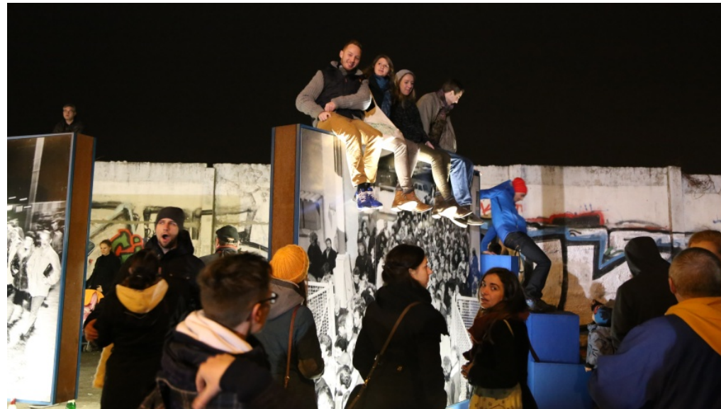
Feier zum Jahrestag des Mauersturzes am 1.1.2015 „Platz des 9. November“ an der Bösebrücke - nach dem Aufsteigen der Lichtgrenze - Foto: m/s

👤 Michael Springer 🕒 9. November 2019 📁 Aktuell, Berlin, Bezirksnachrichten, Slider 📄 🖨️