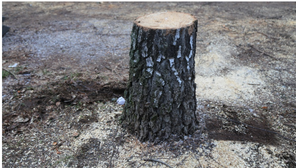
Erst sägen - dann bauen. In der wachsenden Stadt schrumpft das Grün

m/s 🕒 6. Februar 2019 📁 Bezirksnachrichten, Slider