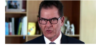
Entwicklungsminister Müller: „Staaten müssen ihre Anstrengungen vergrößern“