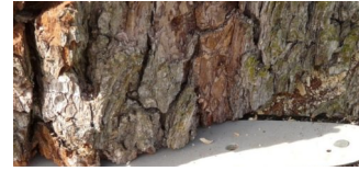
Robinie in der Bötzowstraße muss gefällt werden