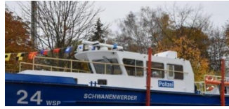
Wasserschutzpolizei Berlin taufte die „Schwanenwerder“