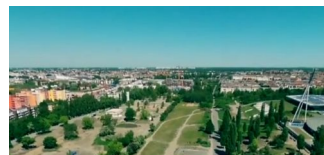
Neue Parkregeln für den Mauerpark 2019 beschlossen