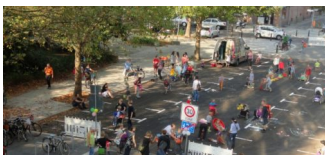
Demonstration für die „Temporäre Spielstraße“ am 8.5.2019