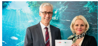
Berlins öffentliche Brunnen in Regie der Wasserbetriebe