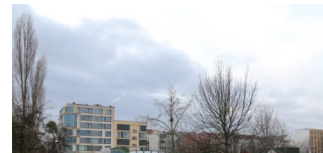
Infoveranstaltung zum Mauerpark mit Überraschungs-Beteiligung