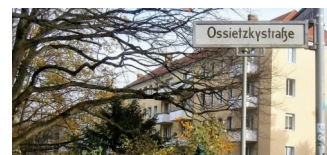
Eklat bei Mieterbeteiligung in Alt-Pankow