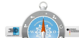
Sicherheitskompass für mehr Internet-Sicherheit