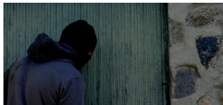
Einbruchschutzberatung im Einkaufszentrum Rosenthal