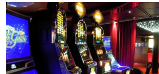
Stadtweite Kontrollen von Spielstätten