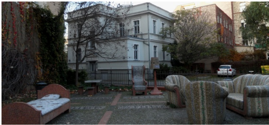
Pocketpark Florastraße 87 – Kunst im Stadtraum von Christine Gersch & Igor Jerschow