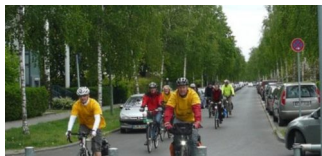
ADFC Pankow lädt ein zur Kieztour durch Weißensee