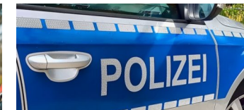
Polizeibericht vom 22.08.2019