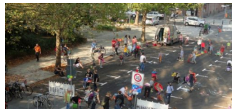
Temporäre Straßen-Spieltage in der Gudvanger Straße