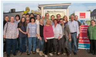
Der neu gewählte Vorstand.

Der SPD-Ortsverein Barop hat in seiner Jahreshauptversammlung am 11. April 2018 der Verlagerung des Reitervereins Dortmund vom derzeitigen Standort an den Westfalenhallen auf die Freifläche an der Stockumer Straße (neben den Kleingartenanlagen) grundsätzlich zugestimmt. Er hält die neu zu bauende Anlage im Verbund mit den benachbarten Kleingärten und der nahen Bolmke für eine Bereicherung der örtlichen Freizeit-Infrastruktur.