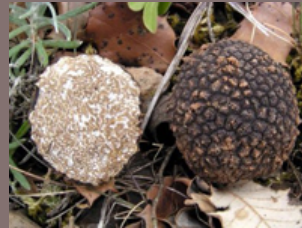
La Truffe blanche d'été ( Tuber aestivum )