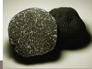
La Truffe noire ( Tuber mélanosporum )