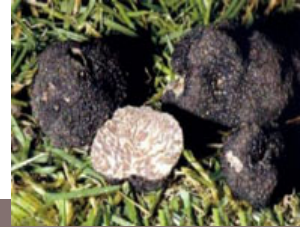
La Truffe brumale ou musquée ( Tuber brumale )