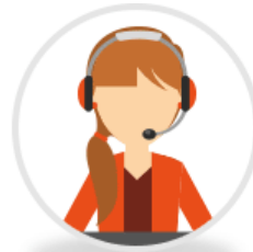
單一窗口專人服務 詳細解答您的疑惑