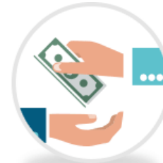
旅責險保至最高 500萬+20萬

*註旅行業責任保險投保金額12歲以下(未滿)及65歲以上(滿)最高投保金額限制NT$200萬 ●●●●●●