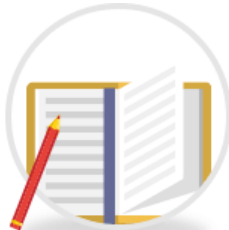
精美朝聖指南手冊 完整旅遊景點介紹