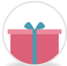
朝聖貼心小禮物 旅行小物三件組